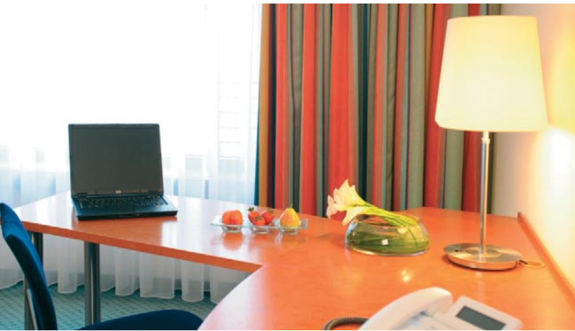
Sektion MARITIM III